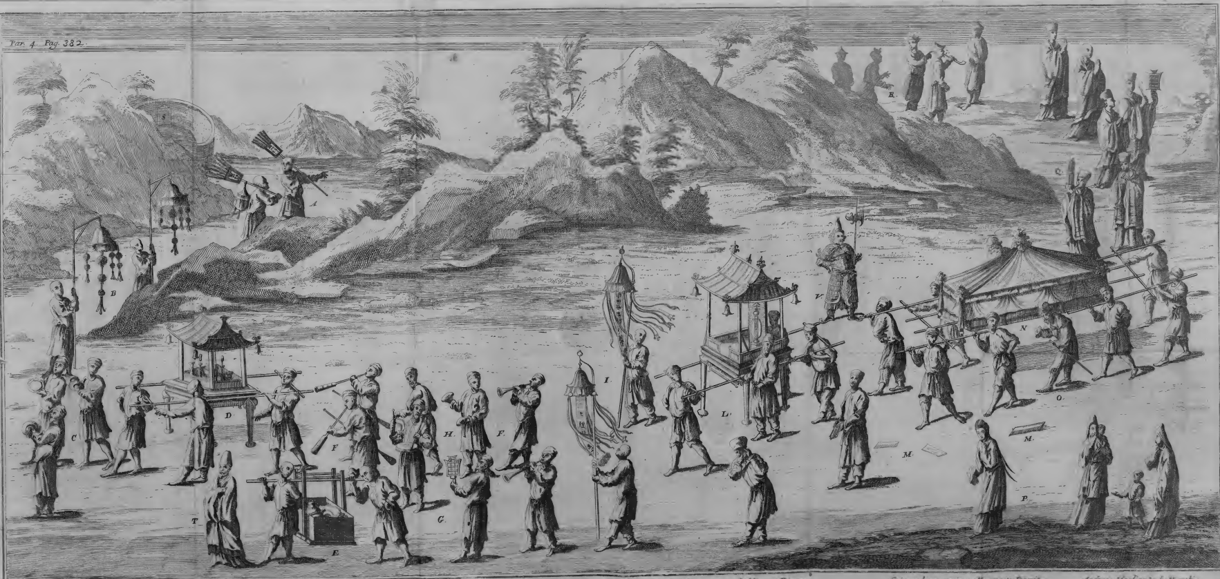
Funerali che si costumano nella Provincia di Quin-tun del Regno della Cina.